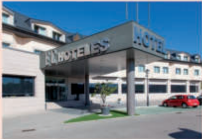
Hotel FC Villalba 4*