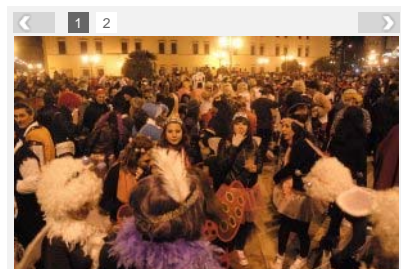
La plaza de San Atón, lugar clave para la celebración de los Carnavales entre los más jóvenes.