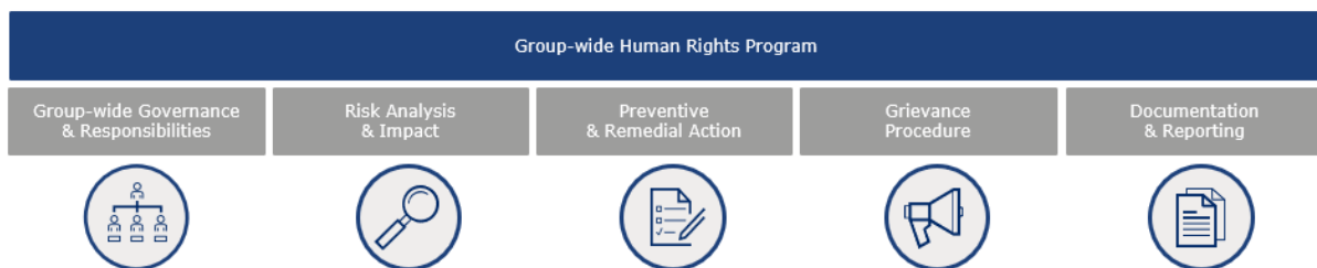
Gráfico 1: Los cinco componentes básicos de nuestro Programa de Derechos Humanos

Nuestra debida diligencia en materia de derechos humanos, para nuestras propias operaciones y cadenas de suministro, se basa en cinco pilares: